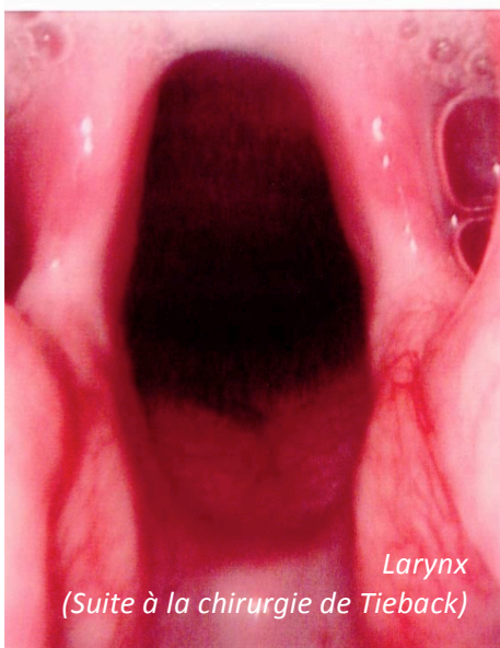
Larynx (Suite à la chirurgie de Tieback)

Le diagnostic se réalise lors de l'examen clinique et sous sédation afin de pouvoir évaluer les mouvements dynamiques du larynx pendant la respiration. Des radiographies du thorax sont également réalisées pour évaluer notamment les poumons et un examen neurologique est également réalisé.